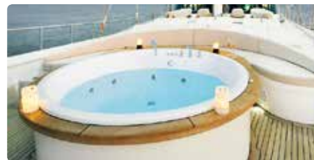
Jacuzzi på dækket af en luksus yacht