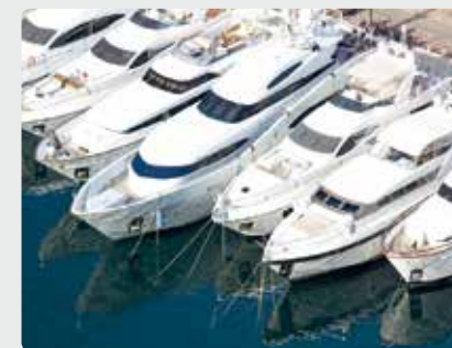
Lystbåde i en stor havn

Vulcan vandbehandling er den miljøvenlige og saltfri løsning til ophobninger af kalk og rust på lystbåde.