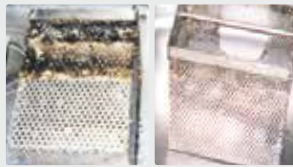
Séparateurs de graisses