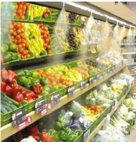
Brumisateurs dans les rayons alimentaires