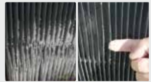
Grilles des tours de refroidissement