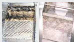
Colector de grasa