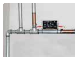
Instalación en interiores