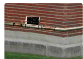
Instalación en exteriores