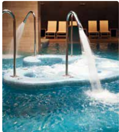
Piscina térmica de água salgada

Vulcan melhora a qualidade da água e, portanto, a eficácia de determinadas substâncias. Vulcan reduz o esforço de limpeza para a piscina em si, para a linha d'água, para os azulejos, grades, pisos e paredes.