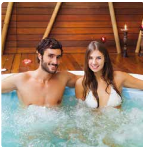
Banheira de hidromassagem na área de bem-estar de um hotel