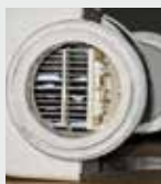
Clorador para piscina