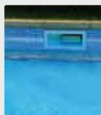
Linha de incrustação de uma piscina