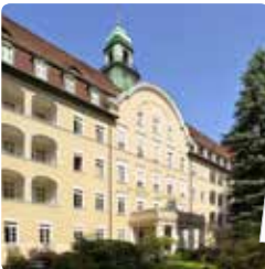
Hospital de St. Joseph, Berlín