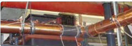
Vulcan S250 instalado en el Hospital St. Joseph

De manera probada, recomiendo sin duda alguna la unidad instalada de Vulcan S250 por CWT GmbH."