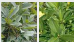
Plantas de invernadero