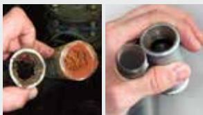
Sistema de tuberías