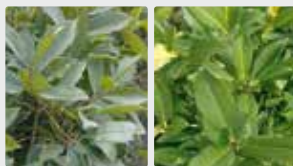
Plantas de invernadero