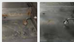
Parrilla de una cocina profesional