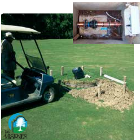
Instalación subterránea en el campo de golf Las Misiones