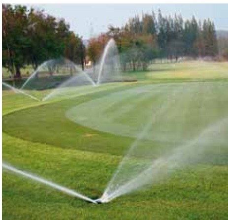
Sistema de aspersores en un campo de golf