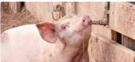
Abreuvoir dans une porcherie