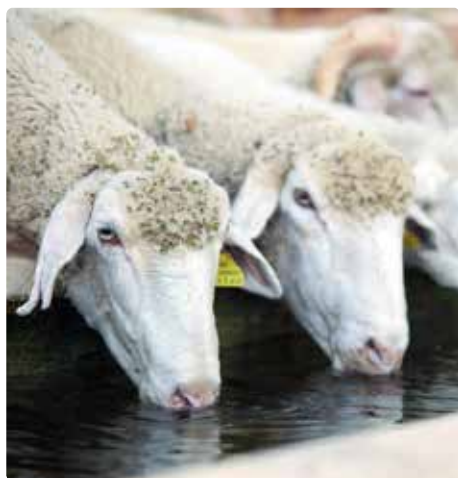
Système d'abreuvement dans un élevage de moutons