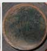
Biofilm présent sur un tuyau