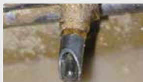
Abrevoir parfaitement propre