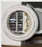
Filtre de piscine