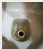
Cuvette de toilette