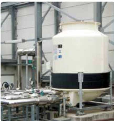
Torre de resfriamento