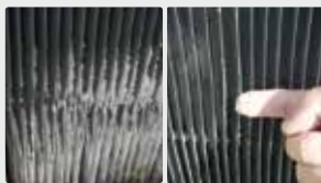
Grades da torre de resfriamento