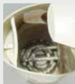
L'intérieur d'une bouilloire