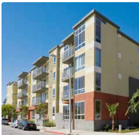
Grand complexe résidentiel