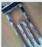
Élément de chauffage dans un réservoir d'eau chaude