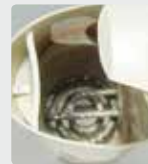
Inde i en kedel